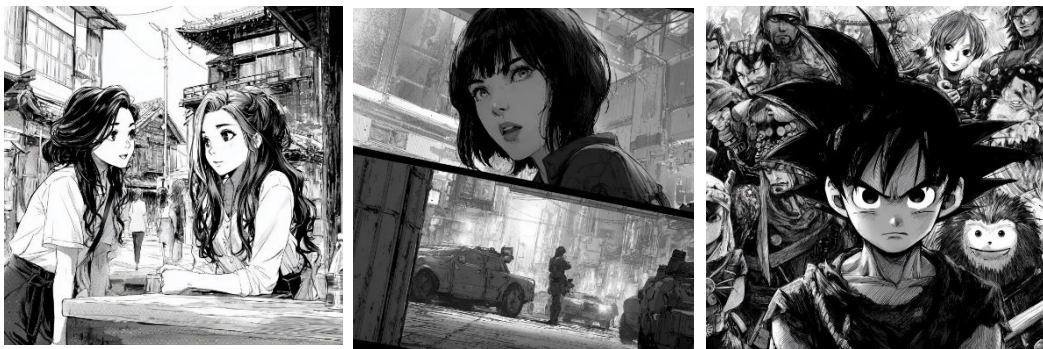
Manga-Stile im Vergleich: Exemplarische Darstellung eines Shōjo, eines Seinen und eines Shōnen-Manga

Zur groben Einordnung sortiert man in Japan zunächst nach Zielgruppen: Shōnen liebt Abenteuer, Freundschaft und das berühmte „Level-up“, Shōjo erzählt von Beziehungen, Gefühlen und Erwachsenwerden, Seinen wird erwachsener und komplexer, Josei bildet realistische Alltags- und Beziehungsthemen ab; für Kinder gibt es eigene Reihen. Diese Schubladen sind keine Mauern, sondern Wegweiser. Quer dazu laufen Genres wie Action, Fantasy, Science-Fiction, Romance, Slice of Life, Sport, Horror, Historisch oder Krimi – mit Mischformen wie Isekai, Mecha, Magical-Girl oder BL/GL. Entscheidend ist, welche Stimmung du suchst: Adrenalin, Trost, Kichern oder Nachdenken.